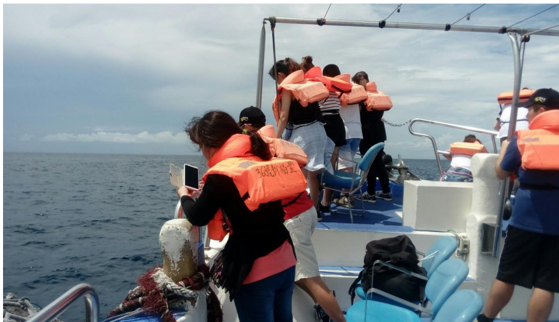
登賞鯨船繞島八景