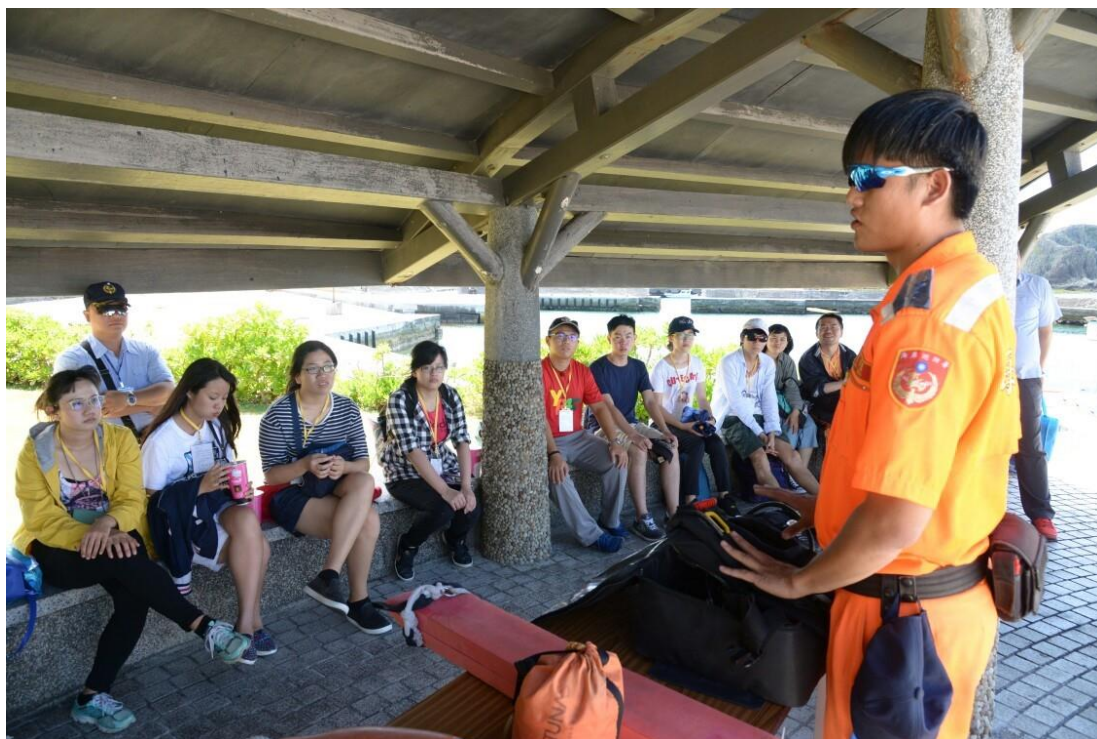
救生救難裝報介紹及體驗