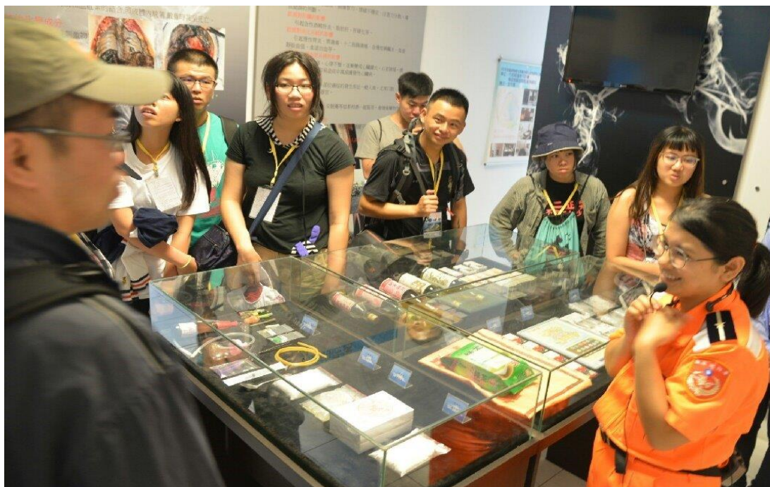
參訪海洋驛站暨裝備