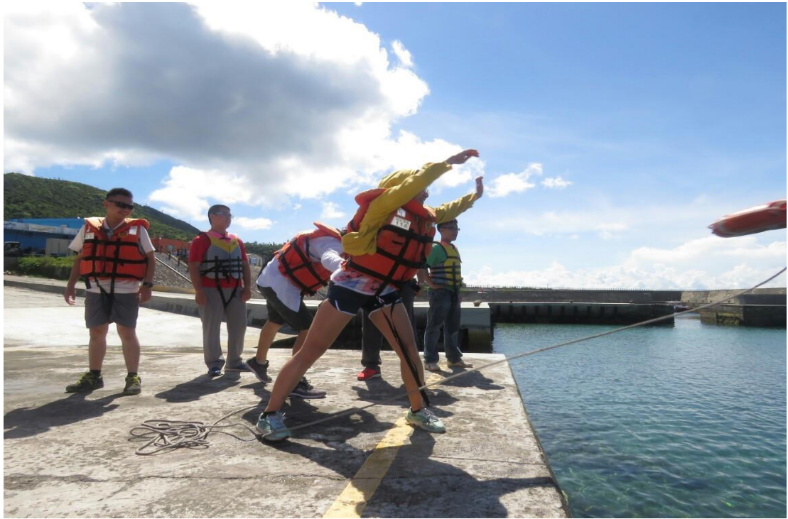
救生救難裝報介紹及體驗