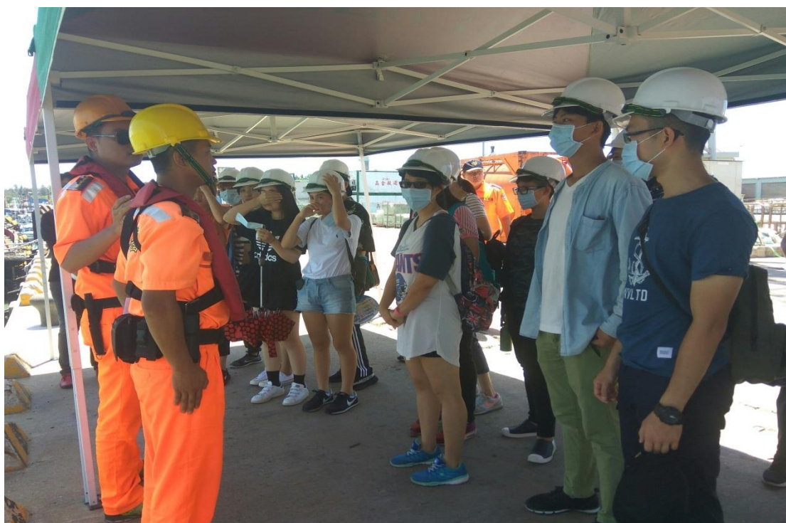
料羅商港小三通貨物安檢觀摩