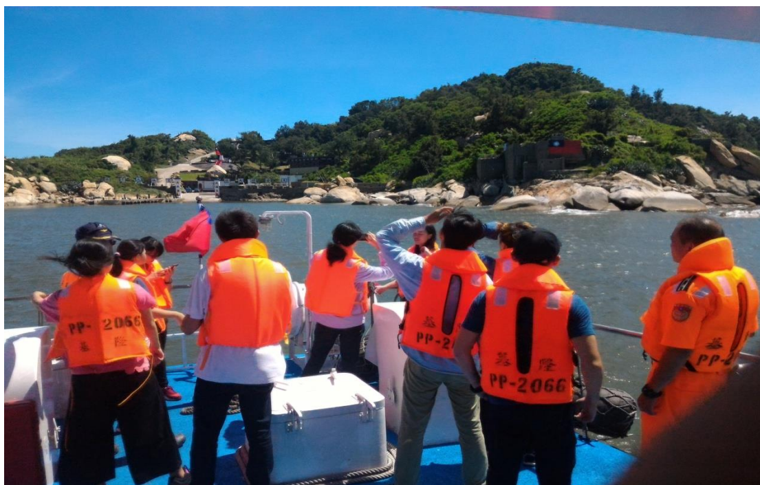
航海體驗大膽島海域