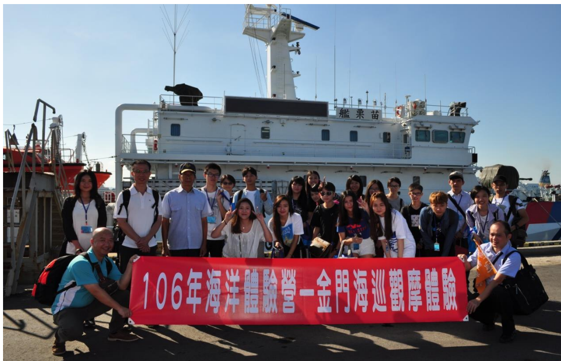
全體學員在苗栗艦前合影