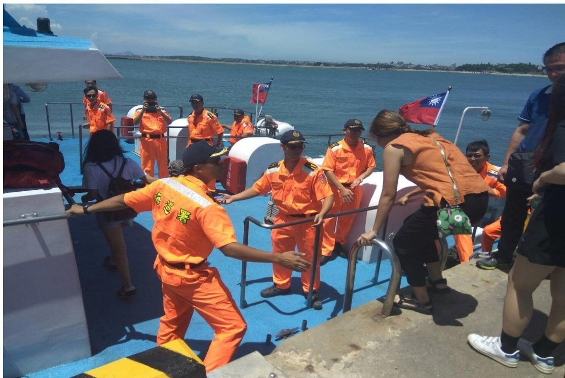
航海體驗學員登艇