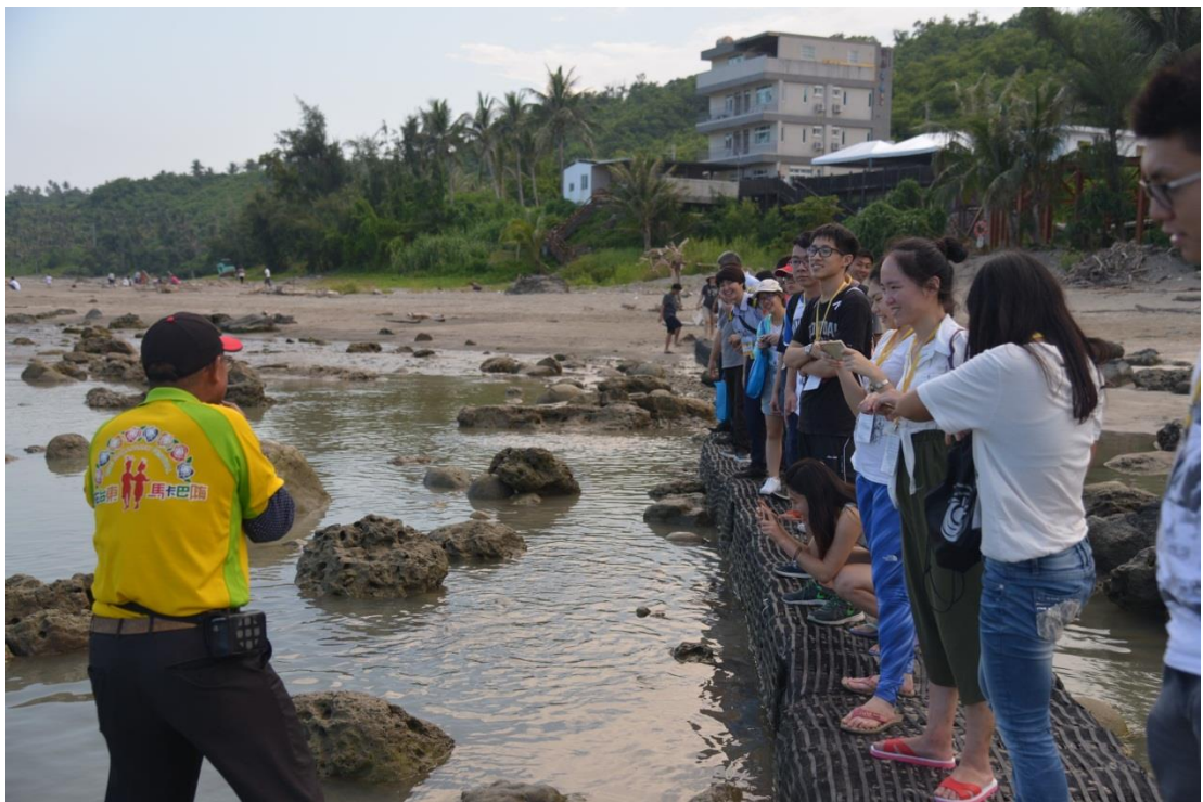
參訪富山漁業資源保護區