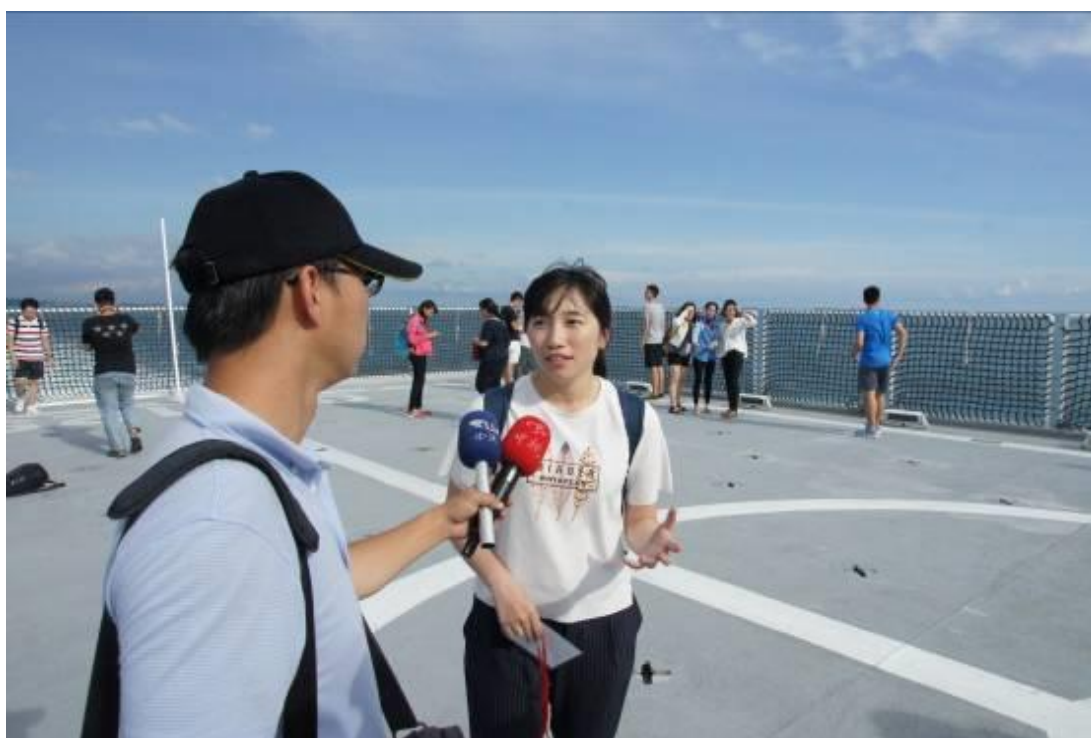
隨訪媒體記者採訪