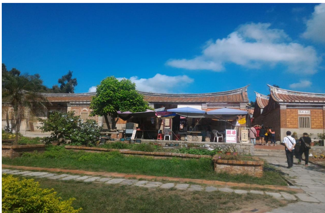
古蹟參訪山后民俗村