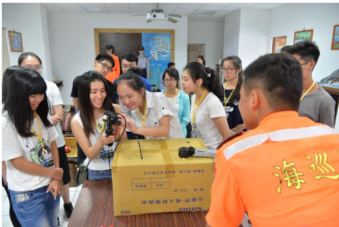
參訪海洋驛站暨裝備