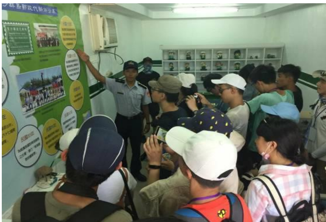
參觀東沙郵局代辦所