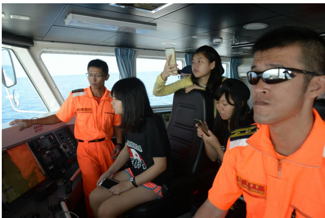
海巡艇任務簡介暨參觀駕駛艙