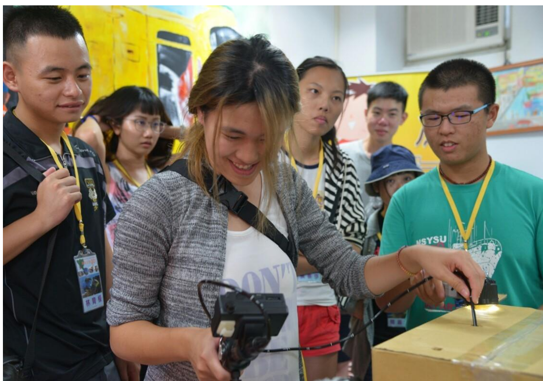
參訪海洋驛站暨裝備