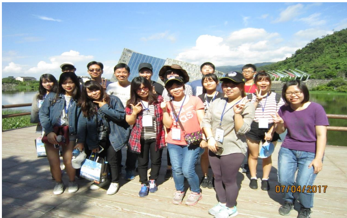
烏石港環教中心集合