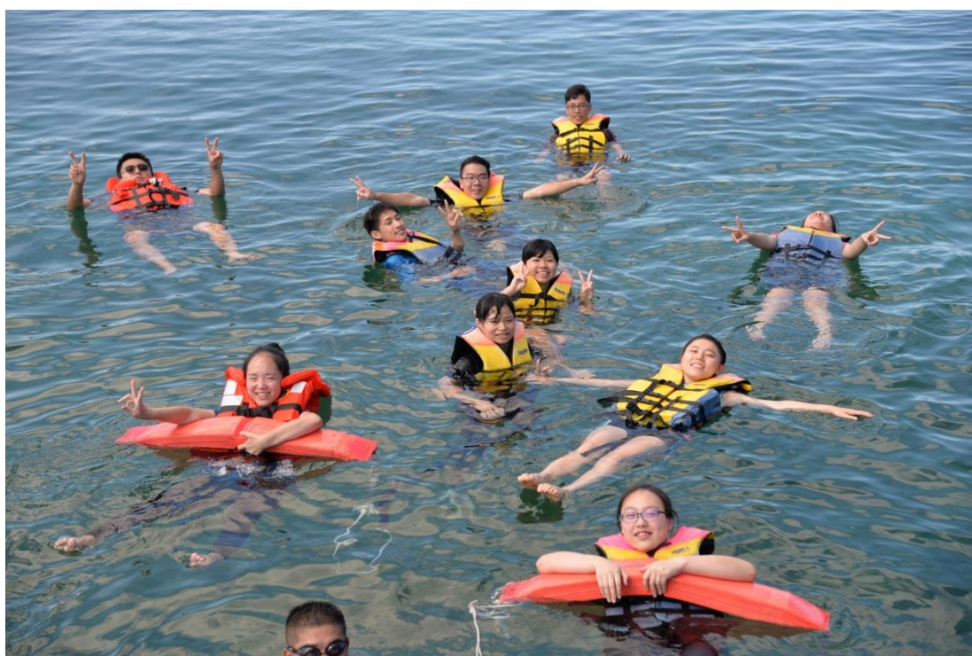
救生救難裝報介紹及體驗