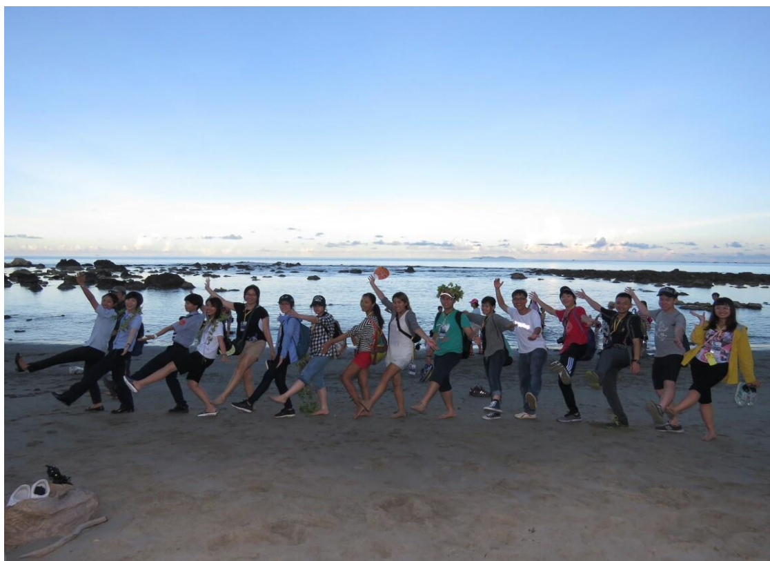
參訪富山漁業資源保護區