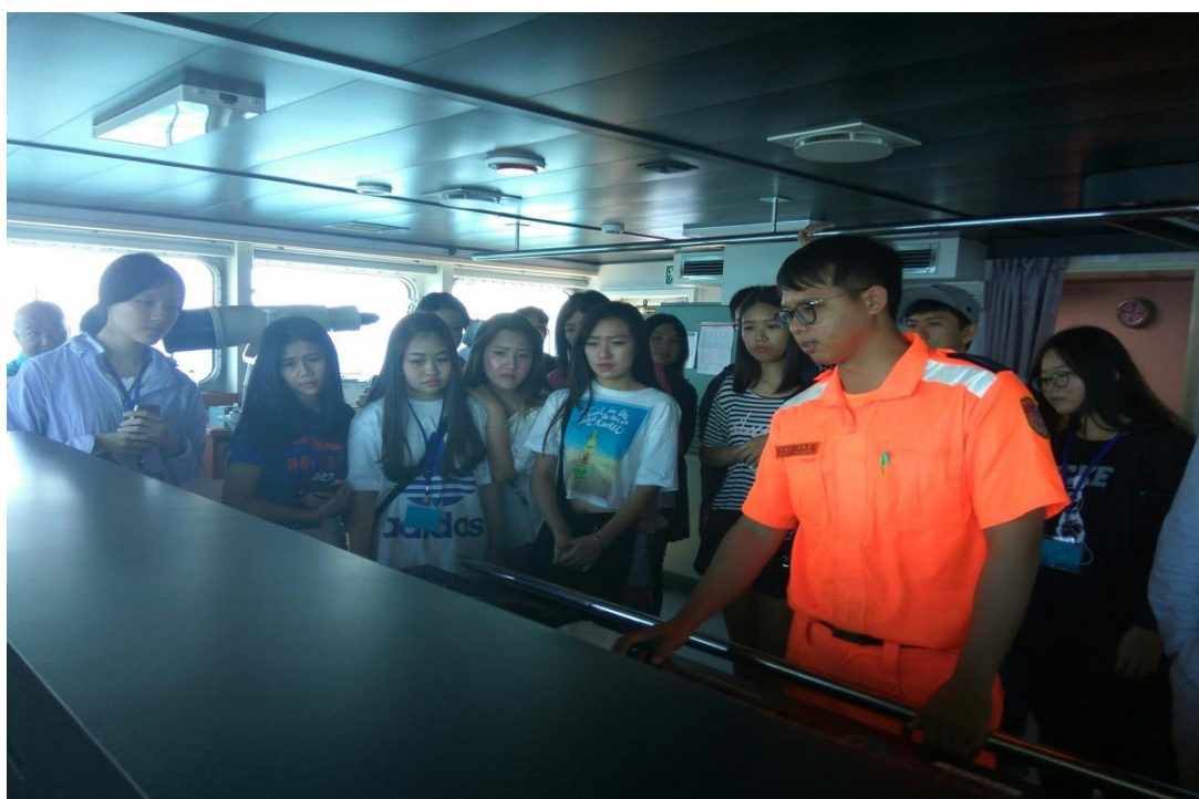
苗栗艦駕駛艙航儀介紹