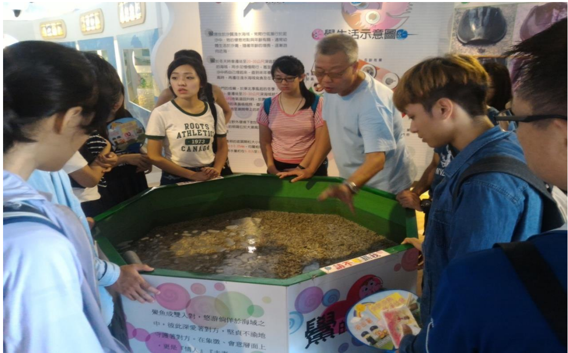
海洋保育參訪金門水試所