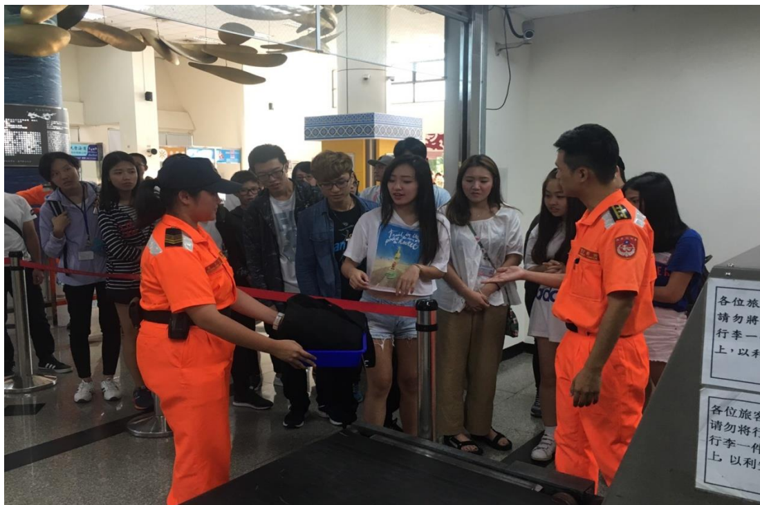
水頭通關中心觀摩-出境安檢