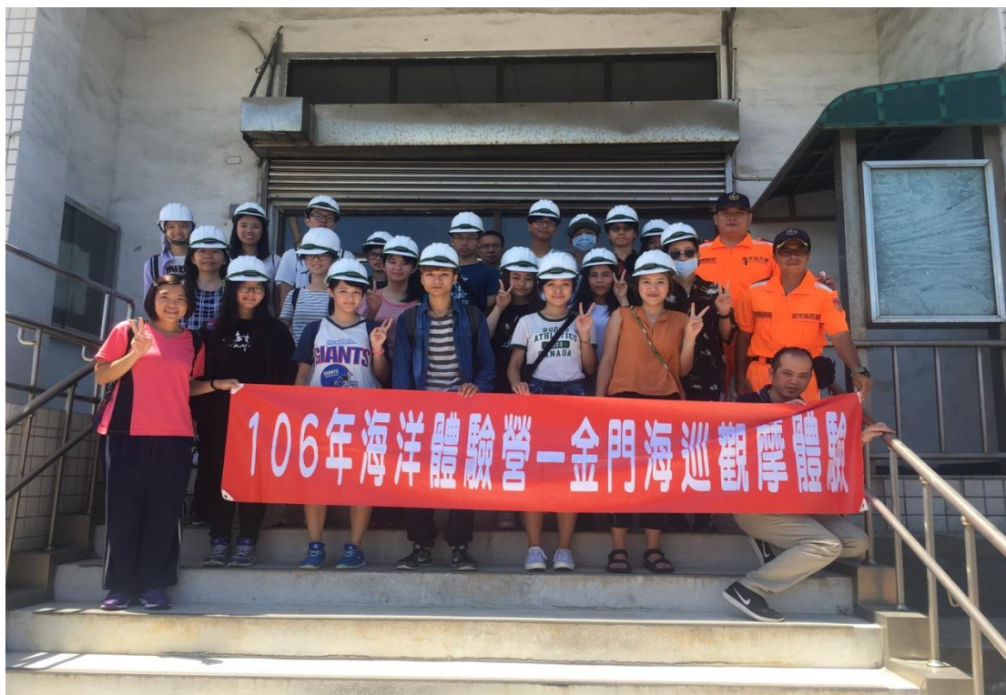
料羅商港安檢所前合影