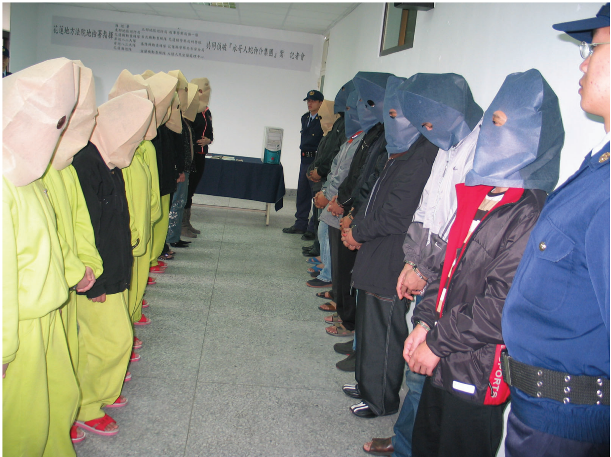
●偵破「水哥人蛇仲介集團」召開記者會媒體競相報導