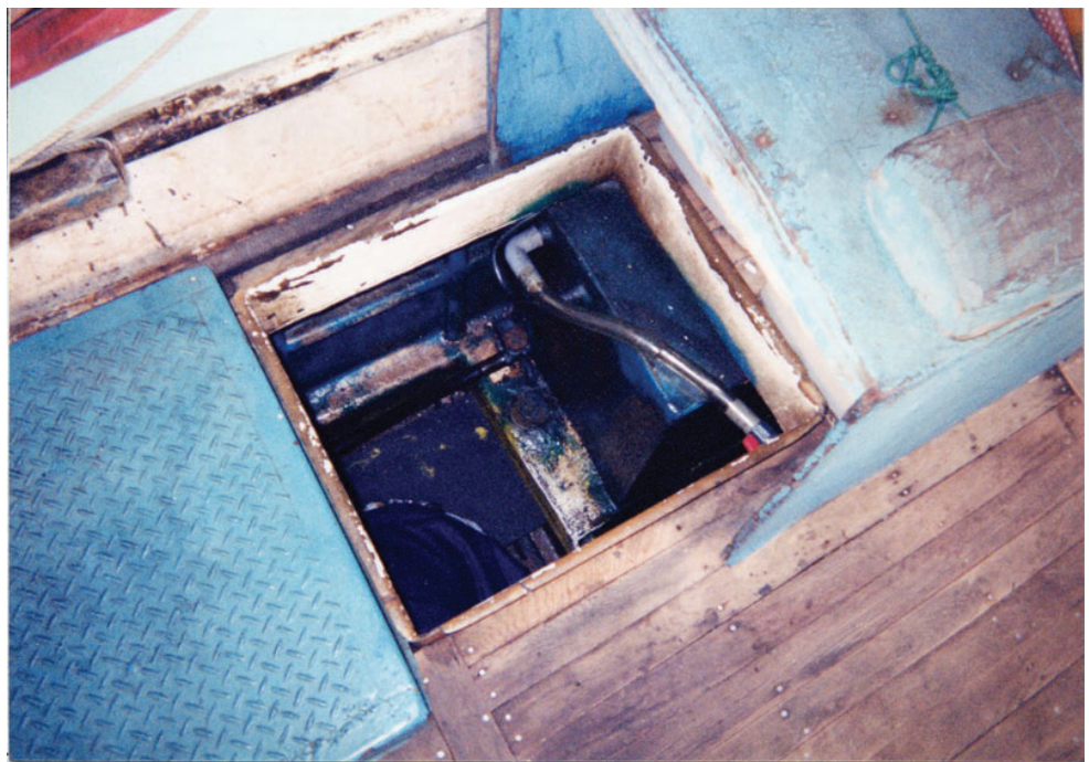
● 涉案漁船狹小之密艙入口