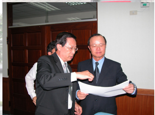
▲ 署長指導署部業務情形