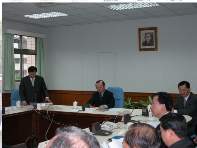
▲ 許署長主持到任後首次署務會報

契約之研究、法庭之騷擾及其處理、從非訟中心之試辦到非訟法官制度之建立、論具有中國特色的大陸司法制度等。