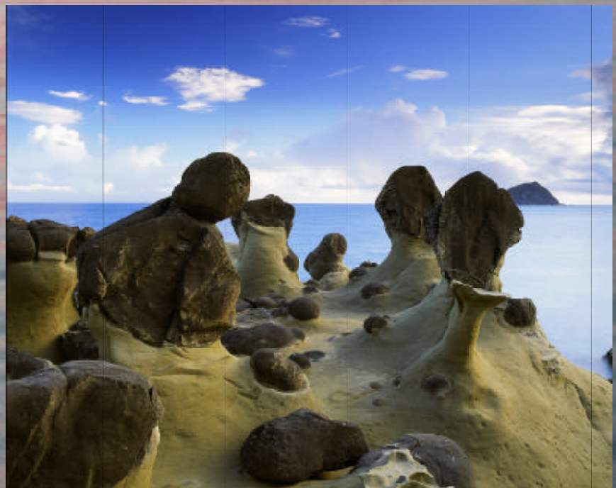
▲ 和平島之最 莊惠茹（學生組優選）