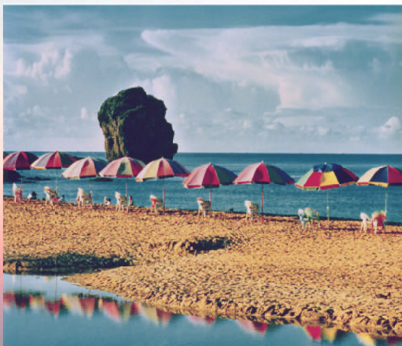
▲ 涼夏的帆船 朱威誠（學生組優選）