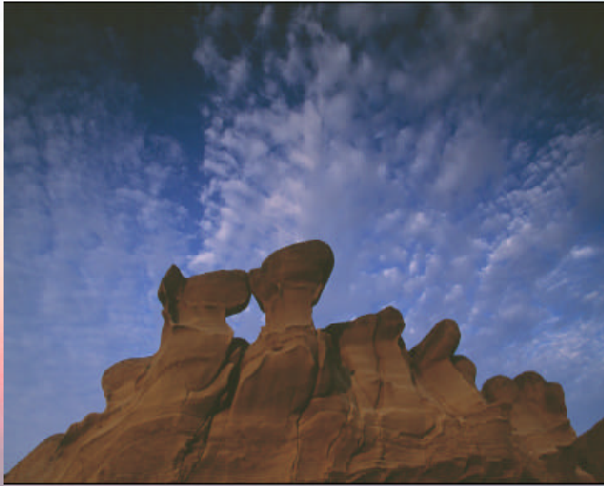
▲ 親 吻 陳帥之（學生組銀牌獎）