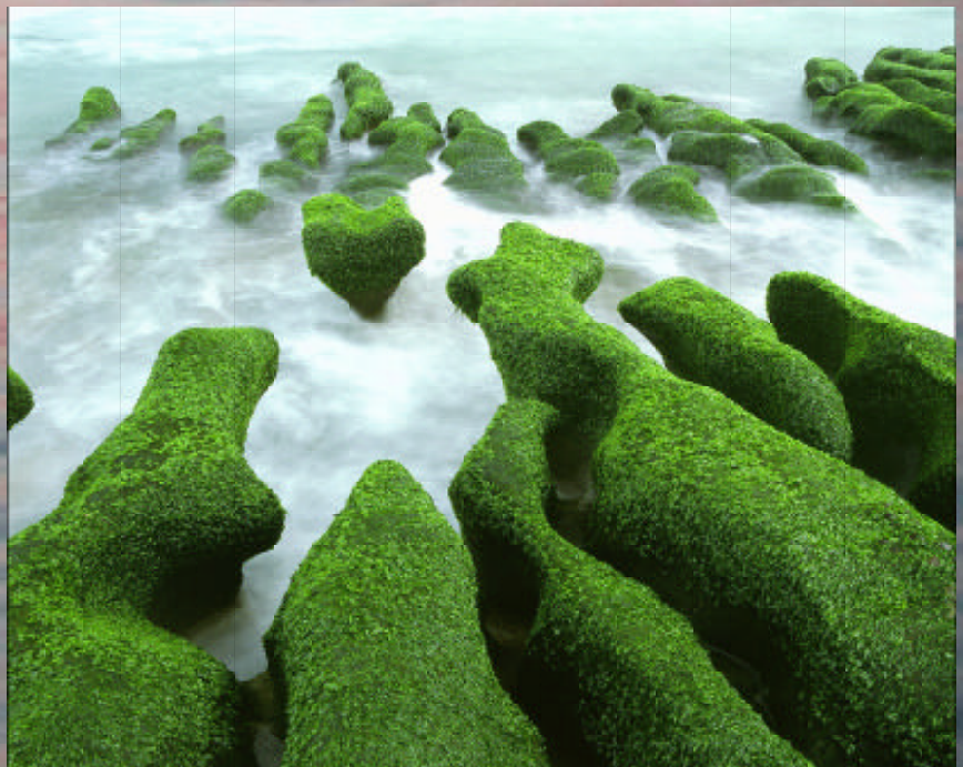
▲ 老梅石槽 莊惠茹（學生組銅牌獎）