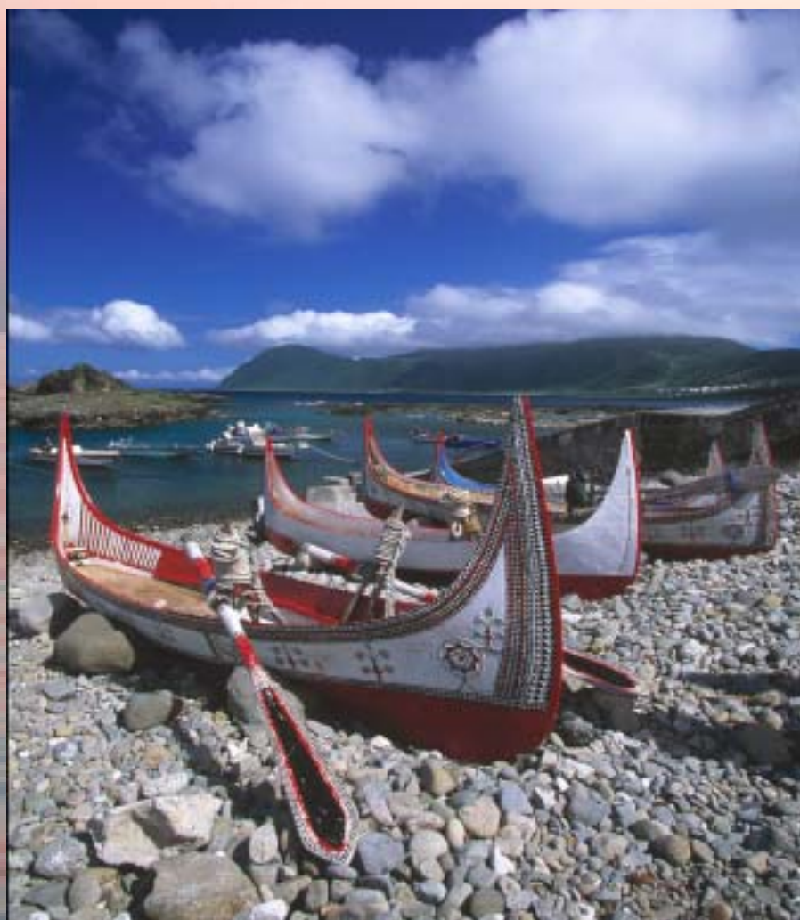
▲ 蘭嶼風光 楊博丞（學生組金牌獎）