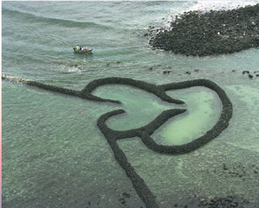
▲ 雙心石滬 王琮賀（學生組優選）