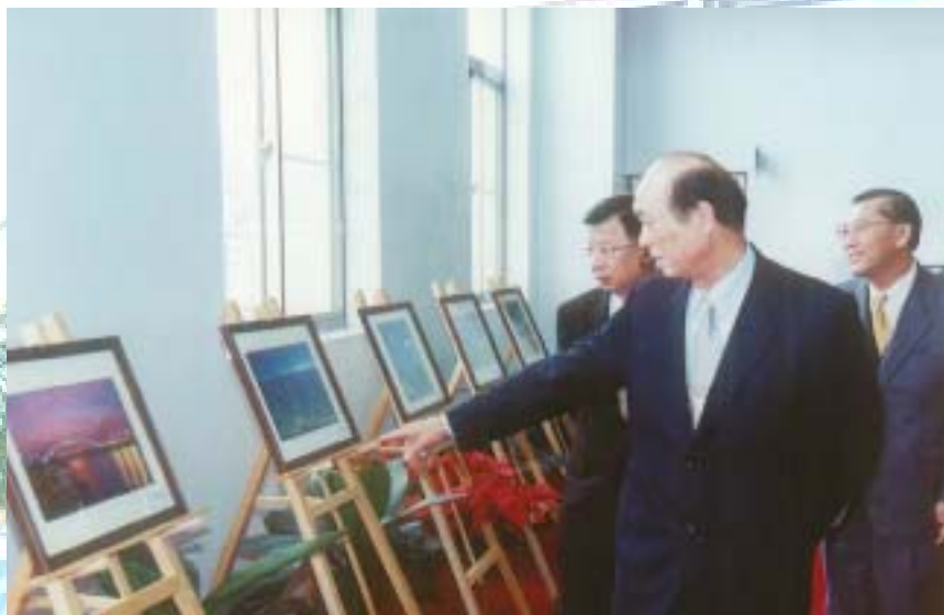
▲ 署長率游副署長、鄭主任秘書欣賞攝影得獎作品