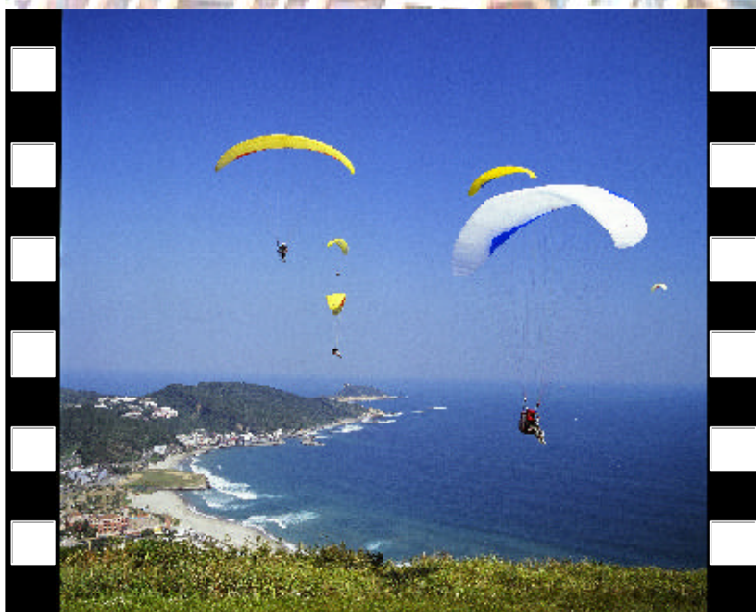
▲ 翡翠灣飛行傘 - 社會組優選 吳志學