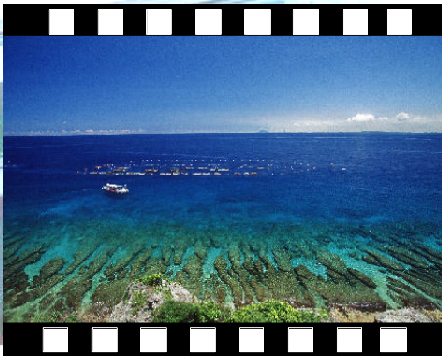
▲ 藍色珊瑚礁 - 社會組優選 洪詩坤