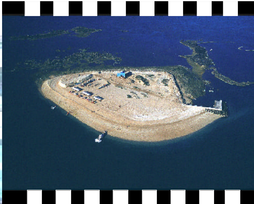
▲ 險礁鳥瞰 - 社會組銅牌 張世彬