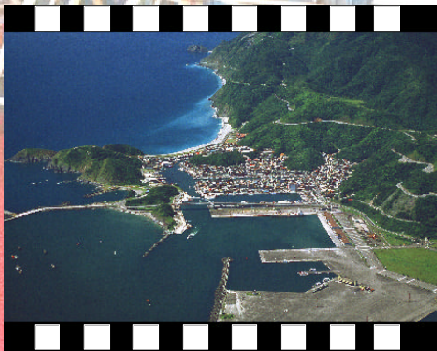
▲ 空眺南方澳漁港 - 社會組銅牌 林明仁