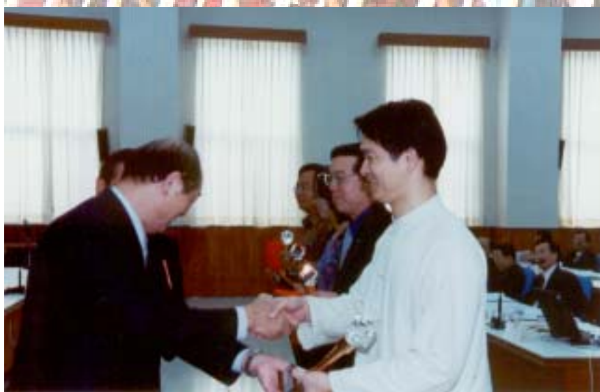
▲ 署長頒發獎盃及獎金予攝影比賽得獎人