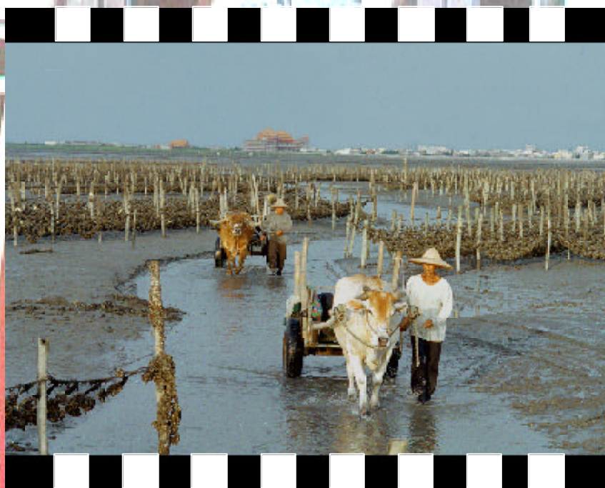
▲ 採蚵人家 - 社會組銅牌 張琨輝