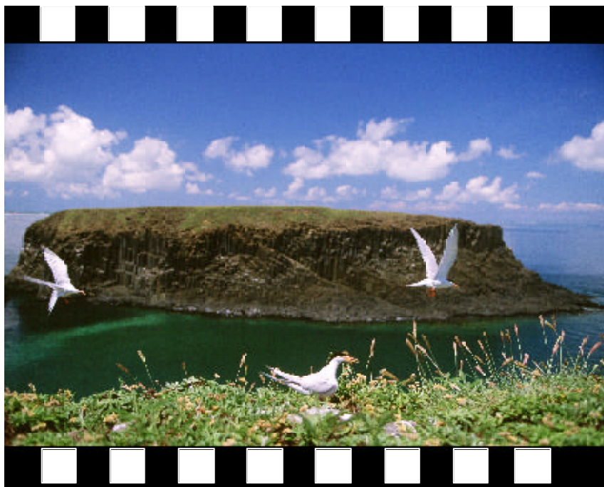
▲ 回 航 - 社會組銀牌 楊 富