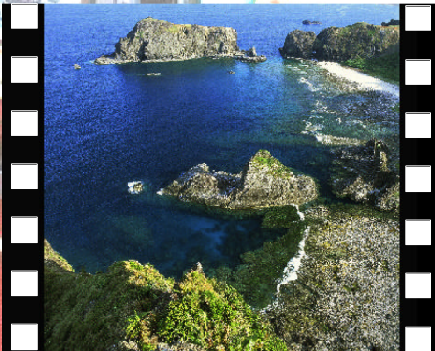
▲ 風景如畫 - 社會組優選 林辰儒