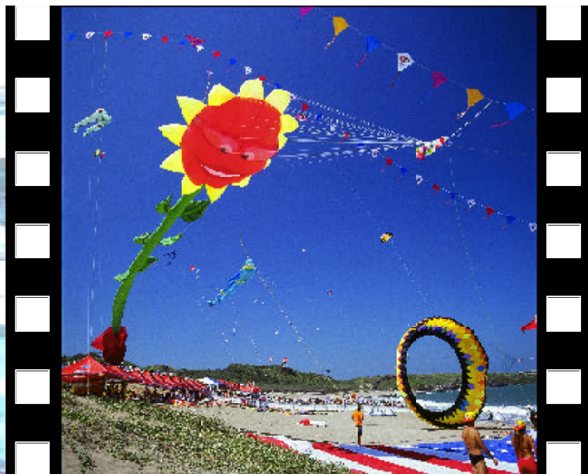
▲ 石門國際風箏節 - 社會組金牌 吳志學