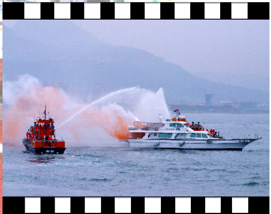
▲ 救難急先鋒 - 社會組銅牌 陳維新