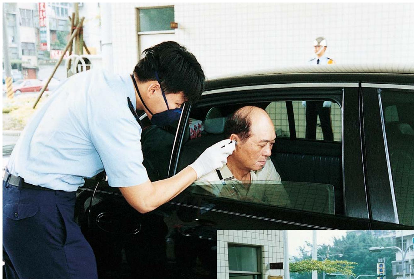
▲配合防疫政策—署長接受體溫測量。

5、有關海巡署因應「SARS」疫情期間查獲漁船走私偷渡案件處理程序及漁船安檢處理流程如附表一、二。