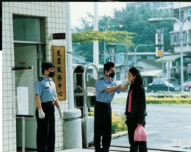
▲配合防疫政策—海巡署進出人員均一律接受體溫測量。

5、查獲大陸偷渡犯即通報衛生單位施予檢疫措施；另對併同查獲之船舶，或來自疫區走私之