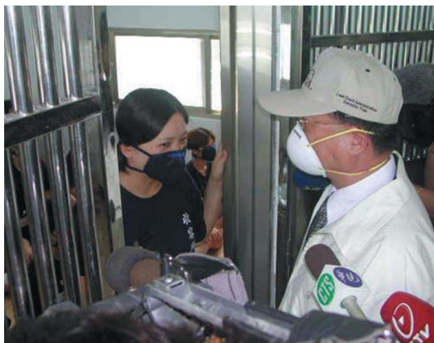
▲游副署長視察大陸人民臨時收容所並詢問防疫措施。

2、因應本次疫情之突發，本署將本次防檢疫工作視同重大任務，全面提昇勤務密度，擴大查緝效能，全力防堵疫情由不正常管道入侵。