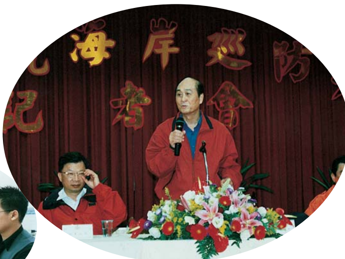
▲署長主持年終記者會