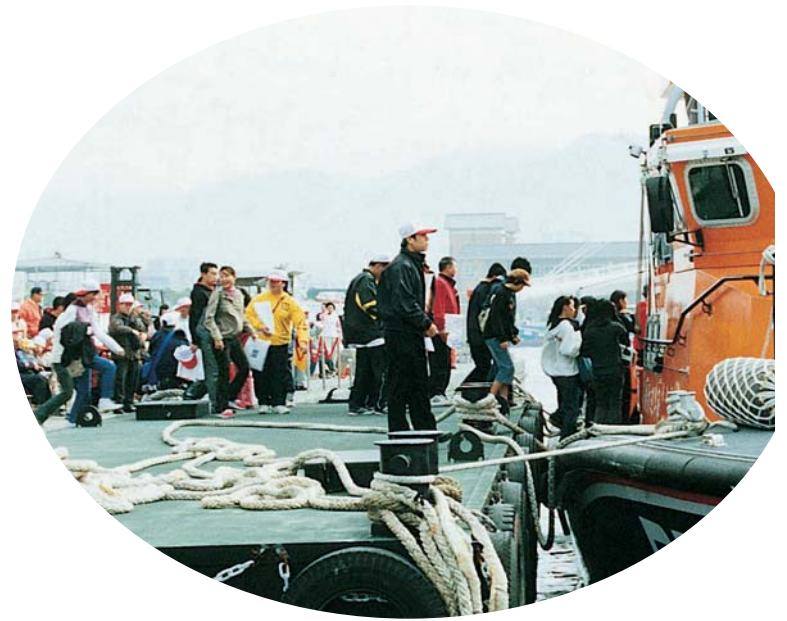
▲ 「海巡之友」競相登艇出海參觀