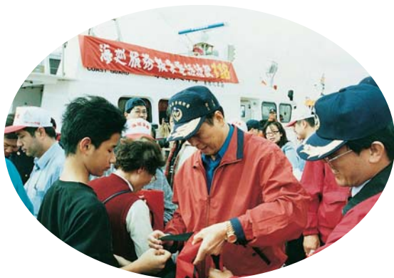
▲ 署長親自示範並指導民眾救生衣穿法