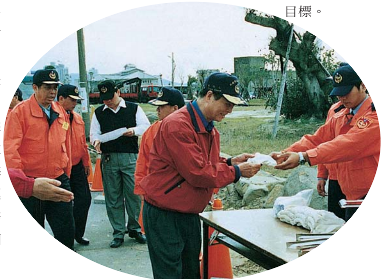
▲準備前往淨灘－署長率領各級主管

機制，保障人安、船安、航安」、「維護海洋環境與資源，善盡國際責任」及「推展海上休憩，鼓勵國人親近海洋」，提昇親民、便民、利民服務績效，開創海岸巡防新境界。也希望海巡署全體同仁都自我期許，在未來半年內賡續完成「安檢全面資訊化」、「保護海域生態」及「落實淨海專案」等重要施政，進而達成海洋資源全民共享、海巡服務全民同惠的目標。