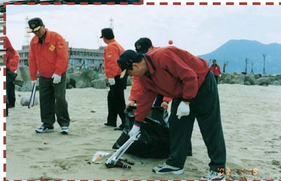
▲還給大家一個乾淨的地球（一）