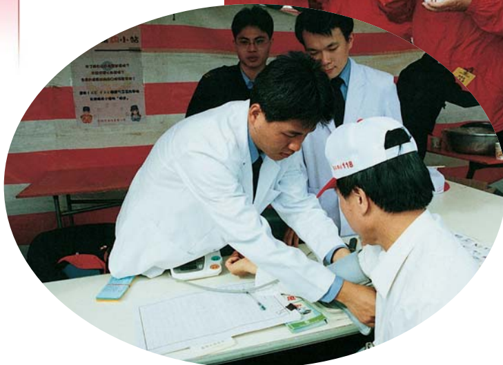
▲ 免費提供民眾健康諮詢服務－園遊會一景