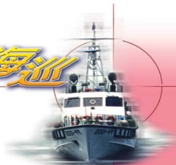
▼自動扶正搜救艇及空中偵巡隊直昇機準備實施操演