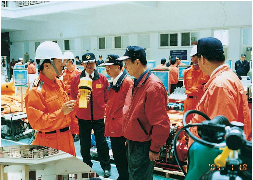
▲署長巡視裝備展示會場並聽取專業人員講解