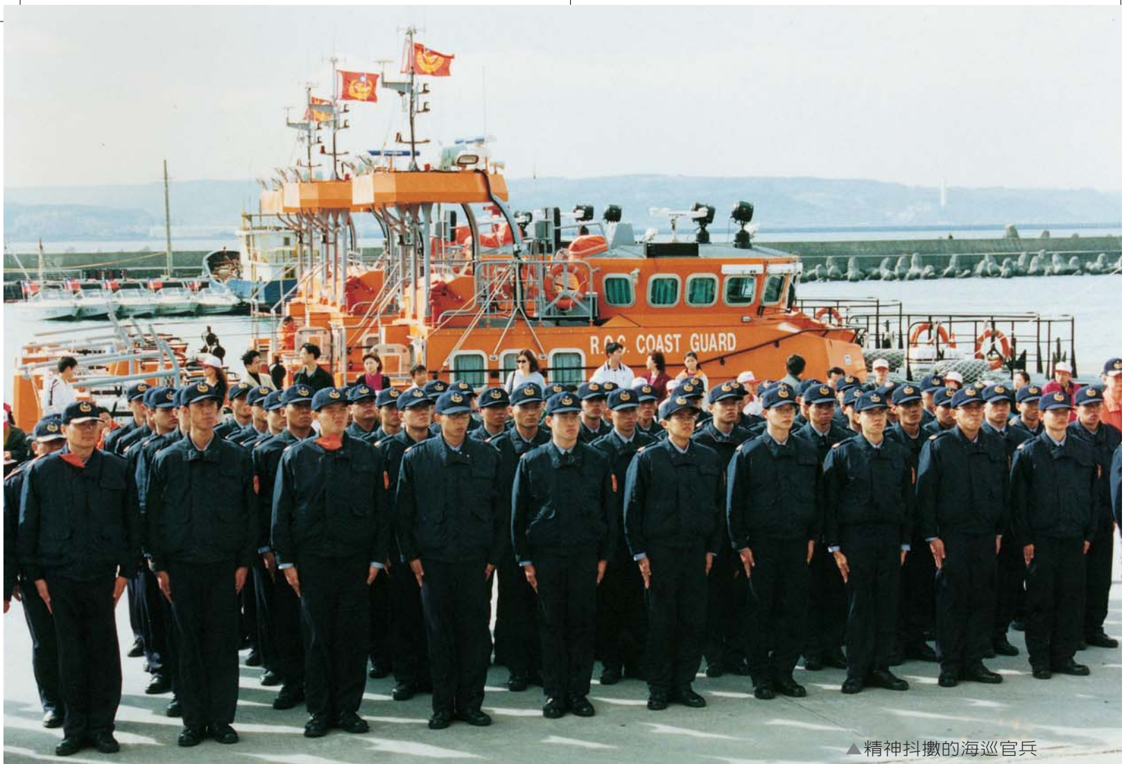
▲精神抖擻的海巡官兵

得寶貴的海洋資源得以生生不息。活動由署長帶領各級主管、官士兵及現場民衆前往沙崙海灘展開「淨灘」揭開序幕，獲得民衆熱烈參與響應；緊接著淡水海巡隊除開放營區供民衆參觀外，並與當地漁民合辦園遊會提供道地淡水美食供參觀民衆品嚐，接著又展示了各式高科技巡防裝備，同時陳列了年來參與海難救助屢建奇功的空中偵巡隊直昇機及各式巡防艦艇並實施演練，隨後開放民衆登艦出海參觀淡水沿海美麗景色，參與民衆皆給予海巡官兵高度讚揚並肯定其保家衛民辛勞。