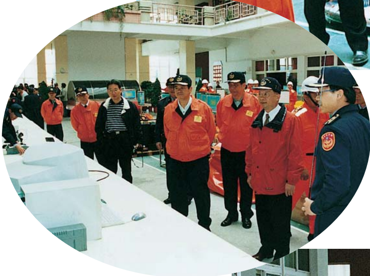
▲游副署長聽取海巡「118」報案資訊系統簡報