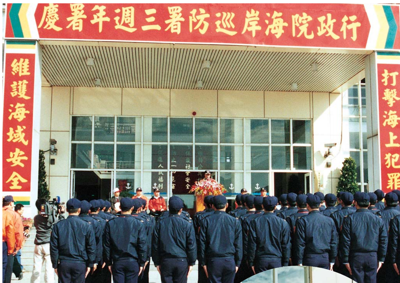
▲海巡官兵聆聽署長訓勉

行政院海岸巡防署為慶祝成立三週年，於元月十八日上午十時假本署海洋巡防總局淡水第二海巡隊營區舉辦擴大慶祝活動，是項活動另分別於臺中（梧棲）、臺南（安平）及各海巡、岸巡等六十一個據點同步舉行，其內容包含了淨灘、營區開放、園遊會、裝備展示及參觀巡防艦艇等項目，邀請各界人士共襄盛舉並舉辦了本署的年終記者會等。