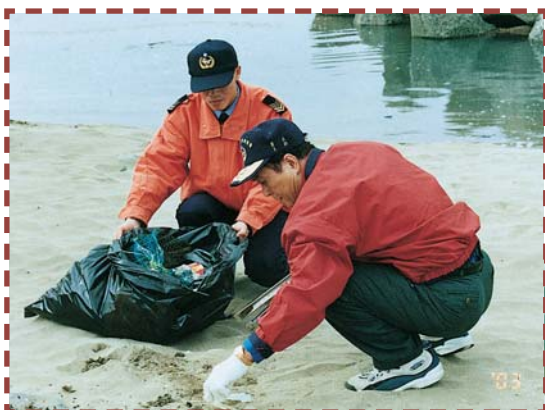
▲還給大家一個乾淨的地球（二）