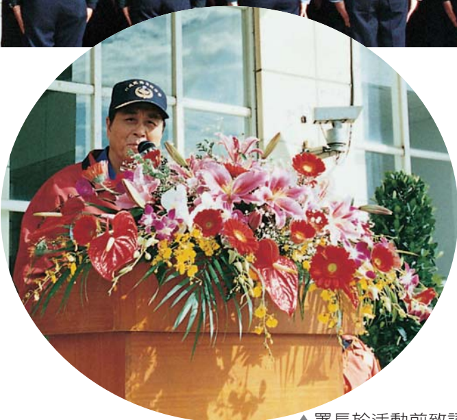
▲署長於活動前致詞

本次活動除慶祝三週年署慶外，另希望透過擴大宣導方式，呼籲國人在我國即將邁向海洋新紀元的時刻，面對著這片浩瀚與蓬勃的新天地，我們更應以謙卑與感恩惜物的心情，進行開發與養護，使