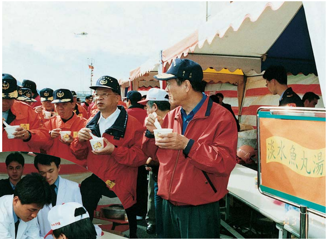
▶ 署長及游副署長 等各級主管 品嚐淡水當地美食