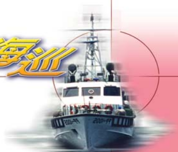
▼巡防艇搭載民眾欣賞淡水沿岸美景