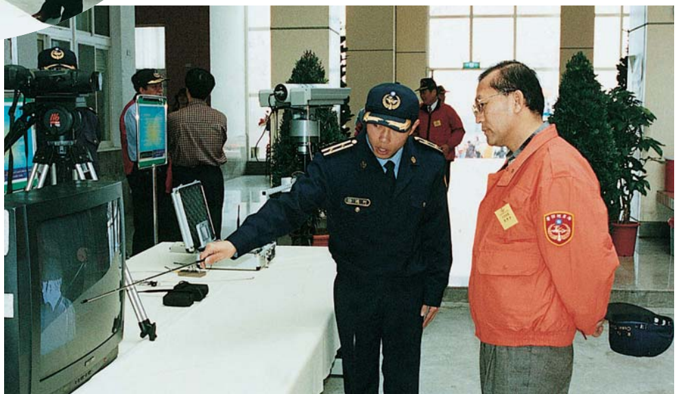
▶ 鄭主任秘書聽取專業人員講解夜間偵蒐裝備