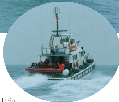
◀準備出發— 自動扶正搜救艇準備出海 讓民眾親自體驗