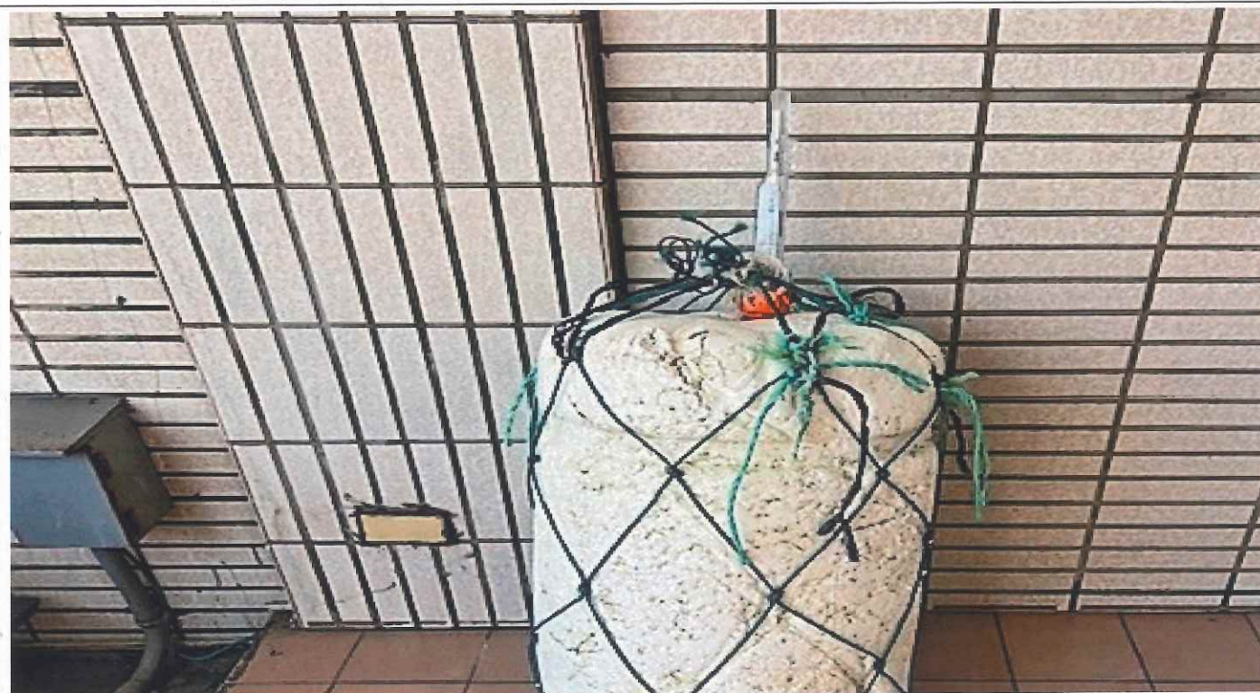
說明： 浮球外觀(長：82 公分、寬：43 公分)