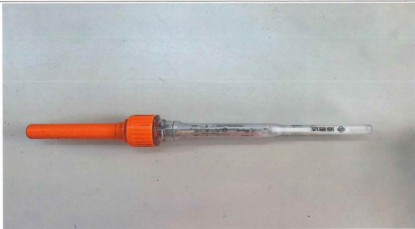
說明： 漁網 AIS 定位器外觀(品牌：海善達、長：31 公分)